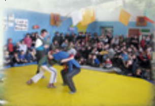
Первенство Спасского района по татарской национальной борьбе Кэрьяш