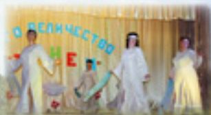
Танцевальный коллектив «Виктория»

Время работы 8:00–17:00 – понедельник – четверг, 20:00–24:00 – пятница – воскресенье. Тел. 2-50-65, e-mail: okmsit2010@yandex.ru