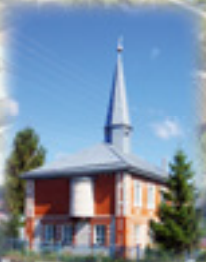
Село Базлово. Мечеть. 1990-е гг.