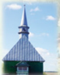
Деревня Ишеево. Мечеть. 1868 г.