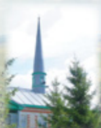
Деревня Тукай. Мечеть. 1990-е гг.