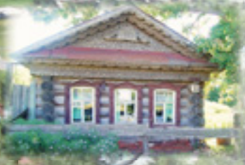
Жилой дом. 1860-е гг. Ул. Рабочая, 33