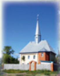
Село Базлово. Мечеть. 1990-е гг.