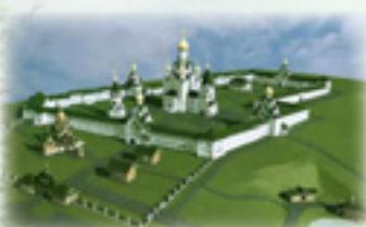
Проект возрождаемого Маровского монастыря