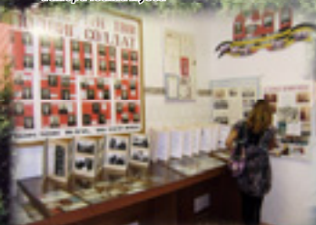
Музей боевой славы Вазьянской средней школы