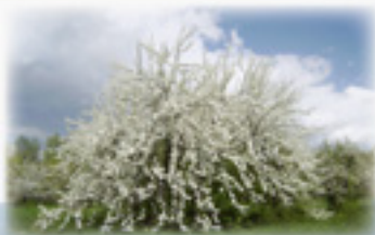
Спаское – яблоневый край