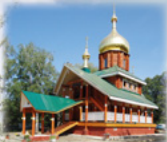
Церковь во имя Святителя и Чудотворца Николая (Никольская), 2011 г.

Ежегодно в августе из Вазьянки на Мары совершается крестный ход с иконой Божьей Матери «Избавительница».