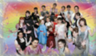
Вокальная студия «Арт-Септима»