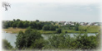
Колхозное озеро в с. Спаское