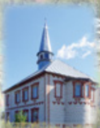
Деревня Ишеево. Мечеть. Начало 2000-х гг.