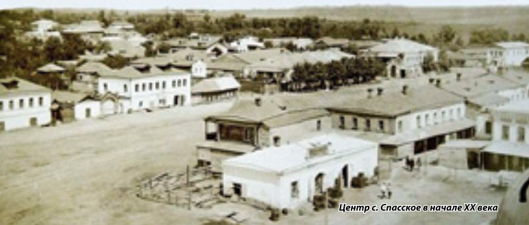
Центр с. Спасское в начале XX века

Важнейшей особенностью социального-экономического развития Спасского края в дореволюционный период было широкое распространение среди его населения торговой и промышленной деятельности. Местные крестьяне, помимо земледелия, освоили около двух десятков промыслов, а также активно занимались отходничеством (плотники, пильщики леса, рабочие на волжских судах).