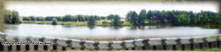
Озеро около д. Сосновка