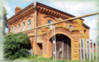
Дом Туриловых. Конец XIX в. Ул. Отары, 30, 33