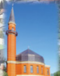
Деревня Ишеево. Мечеть. Начало 2000-х гг.