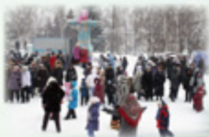
Масленица в Спасском (Проводы русской зимы)