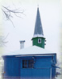
Село Татарское Маклаково. Мечеть. 1991–1992 гг.