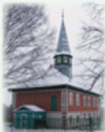
Село Татарское Маклаково. Мечеть. 1991–1992 гг.