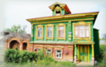
Дом Подлесовых. Вторая половина XIX в. Ул. Рабочая, 10