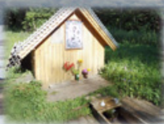
Святой источник на Марах