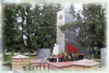
Памятник спасчанам, погибшим в Великой Отечественной войне, 1966 г.