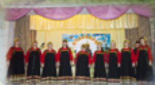
Ансамбль русской песни «Раздолье»