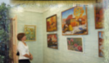
Спасский районный народный исторический музей