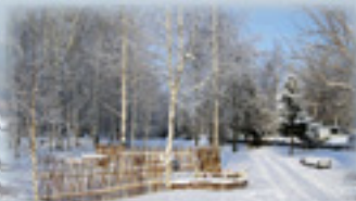
В центральном парке с. Спаское