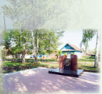
Памятный знак участникам локальных войн и конфликтов, 2011 г.