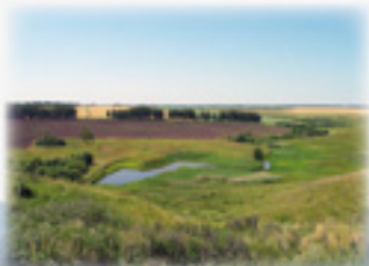
Долина родника Параскевы Пятницы в с. Низовка

Географически Спасский район расположен на юго-востоке лесостепного Нижегородского Правобережья. Здесь протекают одни из экологически чистых рек области – Урга и Имза. На территории района бьют многочисленные родники. Особое, неизгладимое впечатление остается при посещении родникового «царства» в селе Ключищи, где из-под горы с веселым журчанием вытекают десятки источников. На достаточно близком расстоянии (20–30 км) от с. Спасского находятся и более крупные реки – Волга (с. Бармино) и Сура (с. Курмыш). Между селами Русское Маклаково и Бронский Ватрас расположена роща Оболенских – уникальный участок леса, засаженный в начале XX в. кедром, елью и сосной.