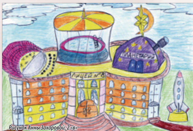
Рисунок Анны Захаровой, 2 «в»