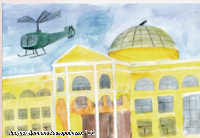
Рисунок Даниила Завгороднего, 1 «б»