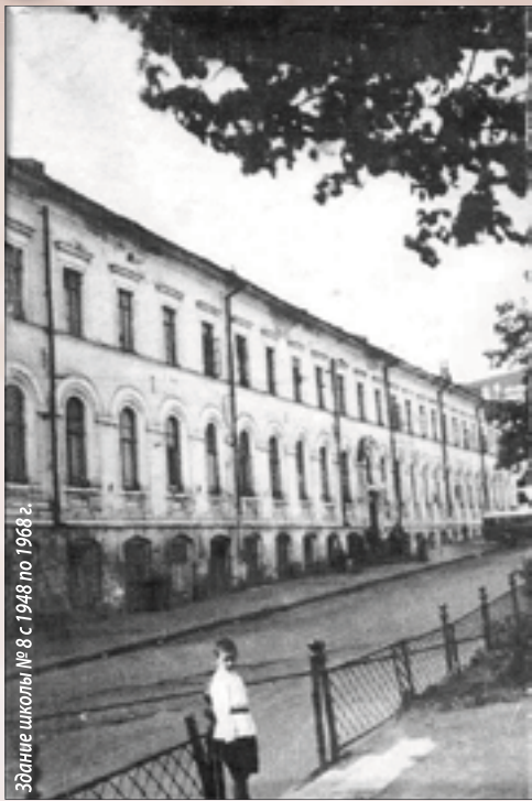
Здание школы № 8 с 1948 по 1968 г.

В самом центре города на пл. Минина стоит классическое здание, где сейчас располагается Выставочный зал. Конечно, плохое здание для него не выбрали бы.