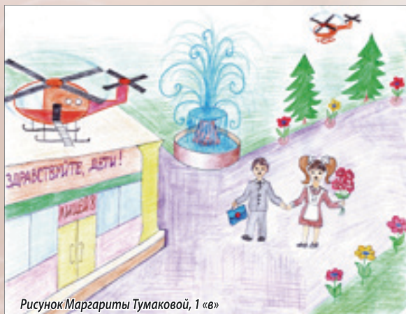
Рисунок Маргариты Тумаковой, 1 «в»